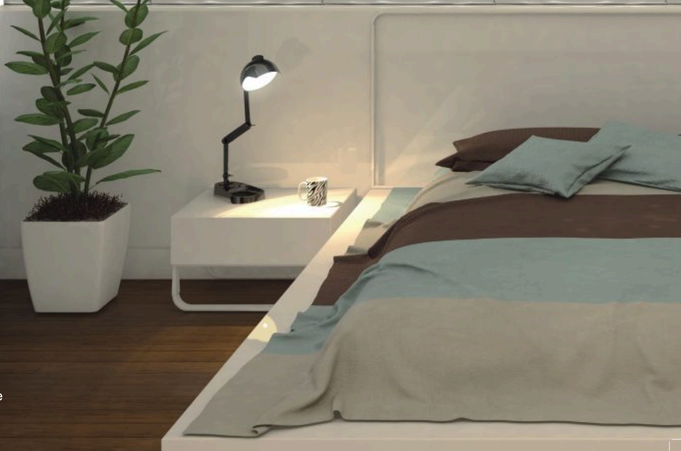
3D Top Wave